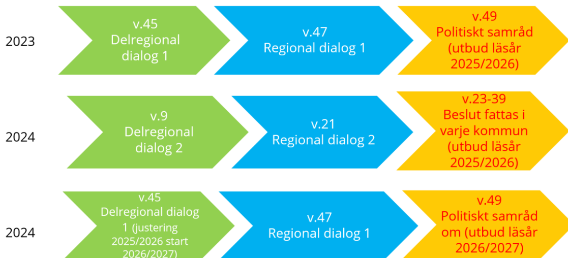
Figur 2:Tidsplan organisation 2025